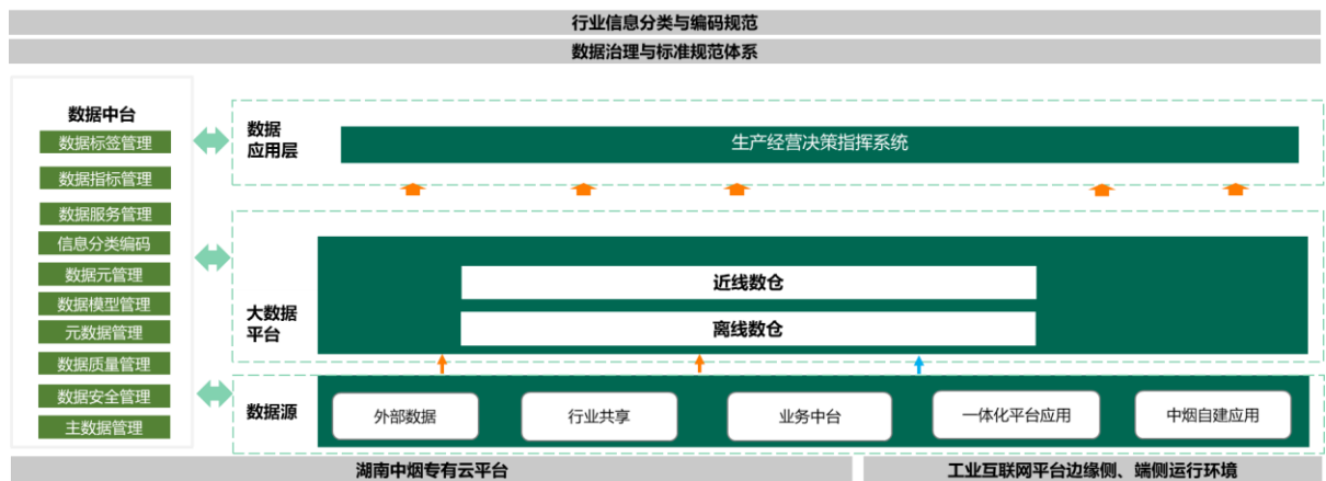
图 数据中心逻辑架构

数据中心前端展现的内容包括销售视角、订单视角、产量视角、财务视角，需要在现有功能的基础上，结合营销中心、企业管理部等业务部门的业务需要，进一步扩展建设，数据中心的架构如下：